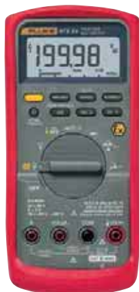
Fluke 87V Ex